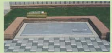
インターロッキング