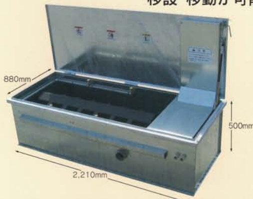
SW-600M シャワー式タイプ

バケット、除雪機でラクラク投雪できます。「融冬静」は広い面積の雪を強力に融かします。 移設・移動が可能な埋設と据置の兼用タイプ。