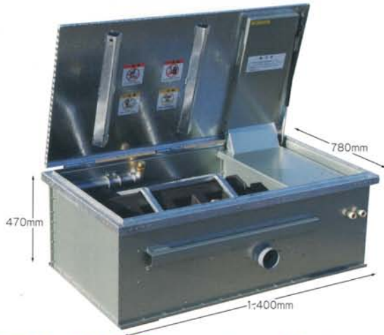
低価格・低燃費のスタンダードタイプ SW-320M シャワー式タイプ