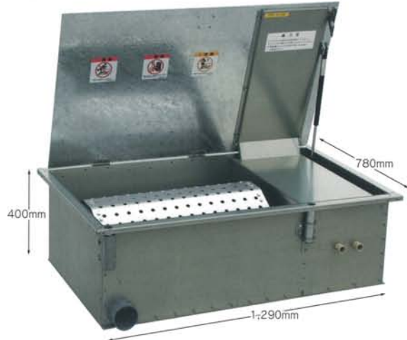
小さなサイズで大きな実力! SW-310M 直火式タイプ